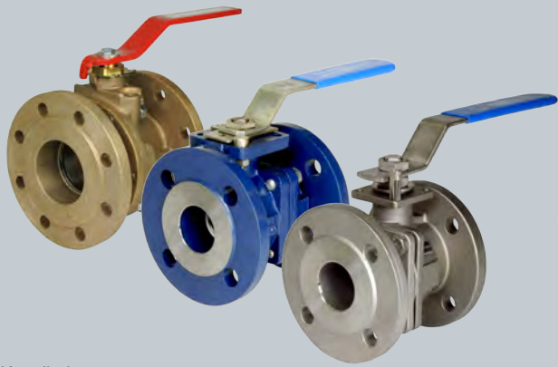
Kugelhahn mit vollem Durchgang mit PTFE-Dichtung Rotguß, Edelstahl, Grauguß

Special designs are possible. Please contact us !