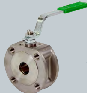
Kompakt-Kugelhahn mit vollem Durchgang „fire-safe“ Edelstahl

Ball-valve with full bore „fire-safe“ stainless steel