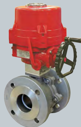
Flanschen-Kugelhahn mit elektrischem Schwenkantrieb mit Handrad für Nothandbetätigung Edelstahl

Ball-valve with full bore „fire-safe“ stainless steel