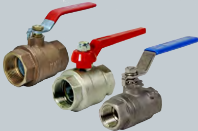
Muffen-Kugelhahn mit vollem Durchgang mit Kupplung Messing vernickelt

Ball valve with full bore with PTFE-sealing gunmetal, stainless steel, cast iron