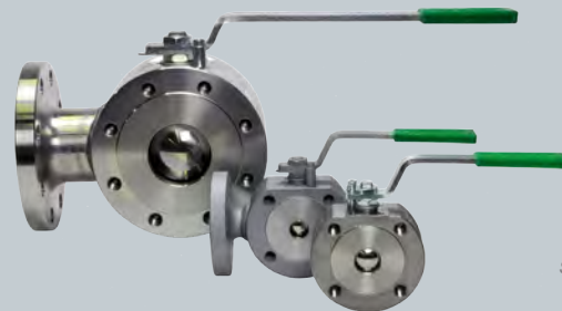
Kompakt- Kugelhähne Edelstahl

Compact 3-way-ball valve with L-plug stainless steel