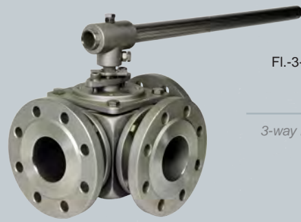
Fl.-3-Wege-Kugelhahn mit T-Küken Edelstahl

Our ball valves are suitable for example for cold and hot drinking-, cooling-, bilgewater, seawater, oil, fuel, steam, saturated steam and air. Also for depleted acids and bases in chemical and petrochemical industries, power plants and shipbuilding.