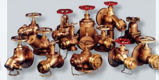
Auszug aus unserem Schlauchanschlußventil-Programm

overview of our landing valve product range