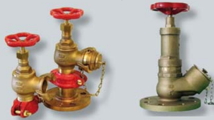
individuelle Produktlösungen nach Kundenwunsch custom-made product solutions

overview of our fire fighting product range