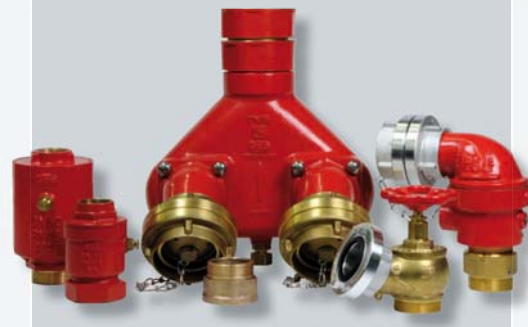
Beispiele unserer Armaturen für den vorbeugenden Brandschutz examples of our building supply fittings