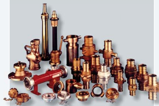
Auszug aus unserem Feuerlösch-Programm

Our branchpipes and nozzles are available with all coupling systems.