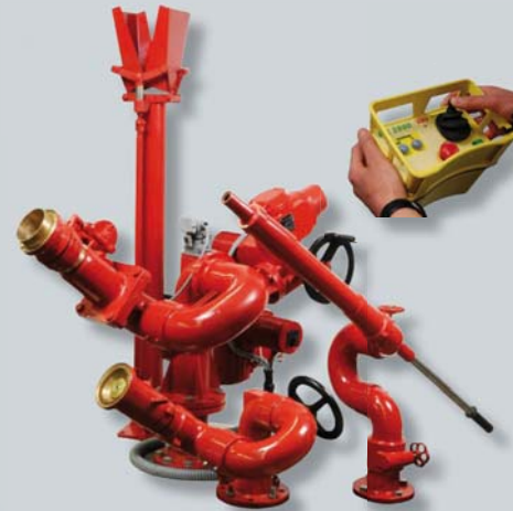
Beispiele aus unserem Monitor-Programm examples of our monitor product range